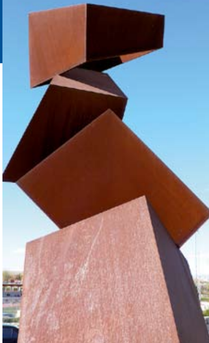
CorTen-staal gebruikt in een kunstobject.